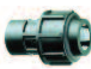
16 a 63mm