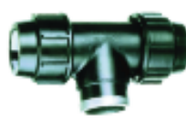
16 a 63mm