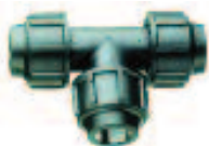
16 a 63mm