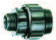
16 a 63mm